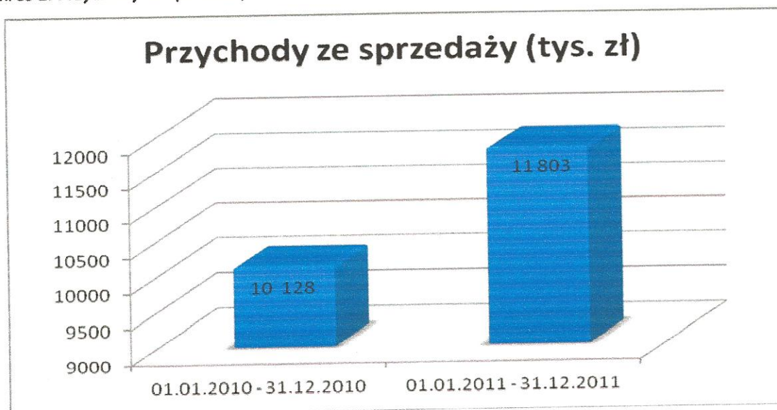
Wykres 1. Przychody ze sprzedaży

W 2011 roku Spółka odnotowała wzrost przychodów ze sprzedaży o ponad 16% (co ilustruje wykres 1) w stosunku do roku 2010. Wynika on z bardzo ambitnej strategii sprzedażowej Spółki, polegającej na wzmocnieniu i reorganizacji działu sprzedaży, pozyskiwaniu nowych obiecujących kanałów dystrybucji oraz sukcesywnym realizowaniu podpisanych w trakcie roku obrotowego istotnych umów handlowych. Głównie wzrost poziomu przychodów Spółka zawdzięcza sprzedaży i wdrożeniu nowych technologii zgodnie z podpisanymi umowami z międzynarodowym holdingiem. Warto podkreślić, że mimo panującej wyjątkowo trudnej sytuacji gospodarczej w strefie euro poziom przychodów sprzedaży do krajów Unii Europejskiej pozostał na prawie niezmiennym poziomie.