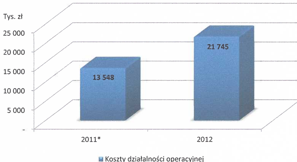
Wykres 2. Koszty działalności operacyjnej Grupy Kapitałowej Aztec International S.A. w latach 2011* – 2012 (w tys. zł)

*Prezentowane dane finansowe za rok 2011 nie są danymi porównywalnymi z danymi skonsolidowanymi, ponieważ konsolidacja sprawozdań finansowych Grupy Kapitałowej dokonywana jest od dnia 01.08.2011 r. tj. daty rozpoczęcia sprawowania kontroli nad spółkami zależnymi.