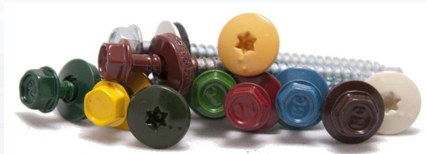
Wkręty i podkładki