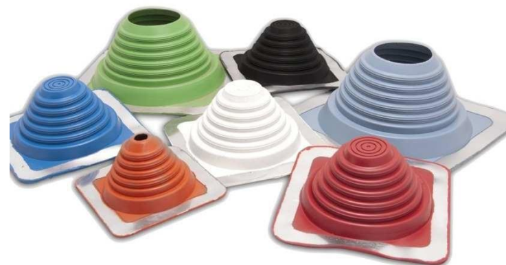
Kołnierze uszczelniające Master Flash®